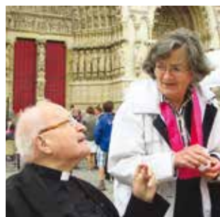
SECTEUR / P5 Fête de la Saint-Firmin