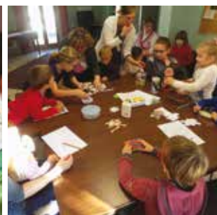
ATHIES / P11 Éveil à la foi