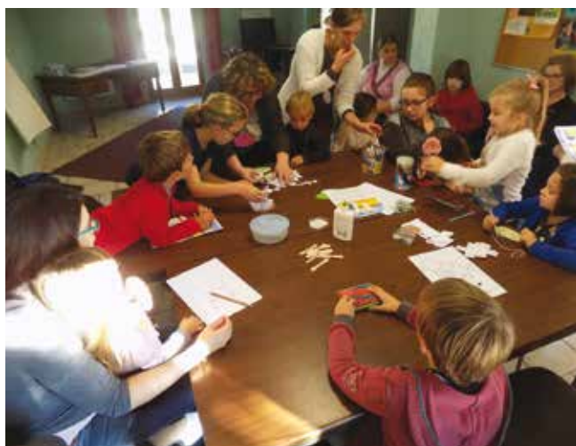
■ Une séance de travaux manuels très prisée par les enfants.