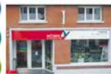
Entrée du magasin.

Ne vous fiez pas aux apparences, COMPAREZ les prix !