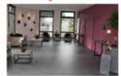
Hall d'accueil du funérarium.