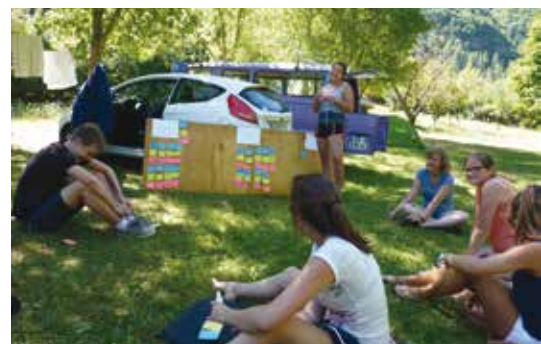
■ Un agréable séjour partagé avec bonheur par les jeunes campeurs du MRJC.

Durant dix jours, huit jeunes lycéens et étudiants du MRJC de la Somme sont partis découvrir la Lozère, plus particulièrement Ispagnac avec comme thématique l'encyclique du pape François «Laudato si'», la sauvegarde de notre planète.