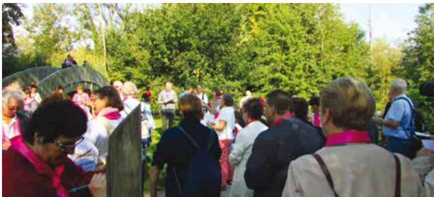
■ Les participants du groupe de Haute-Somme ont emprunté le chemin des écoliers pour se rendre à la cathédrale.

« Bonjour Esprit saint, je t'aime Esprit saint, que je vive tout ce jour dans ton souffle. » Cette courte prière d'un pasteur sud-africain, monseigneur Le-