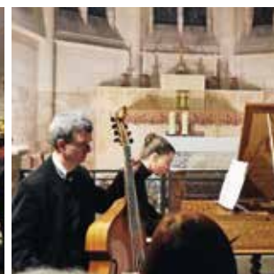
FALVY / P10 Concert de Noël