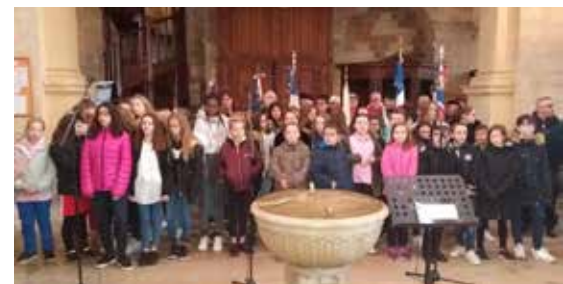
■ La chorale des élèves du public et du privé lors de la commémoration du 11 novembre.

En effet, composée de collégiens de Victor Hugo et de Notre-Dame mais aussi d'écoliers et de jeunes de l'école de musique, cette chorale a exécuté un répertoire de