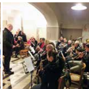
NESLE / P9 Fête de la Sainte-Cécile