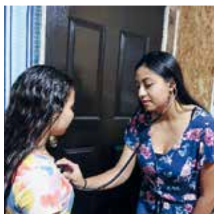
CCFD-TERRA SOLIDAIRE / P7 Collecte pour le Mexique