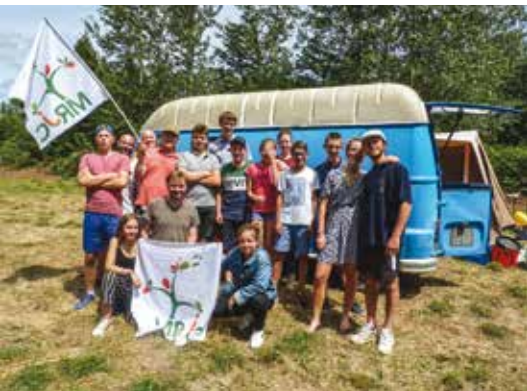
■ Dans les Ardennes.