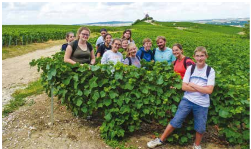
■ En Champagne.