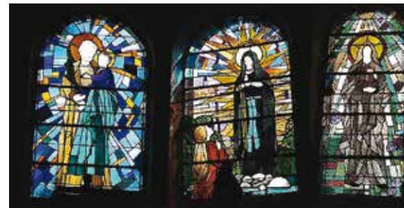
■ Les trois nouveaux vitraux.