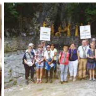
ATHIES / P10 Souvenir de pèlerinage