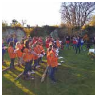
SECTEUR / P5 Rentrée des scouts