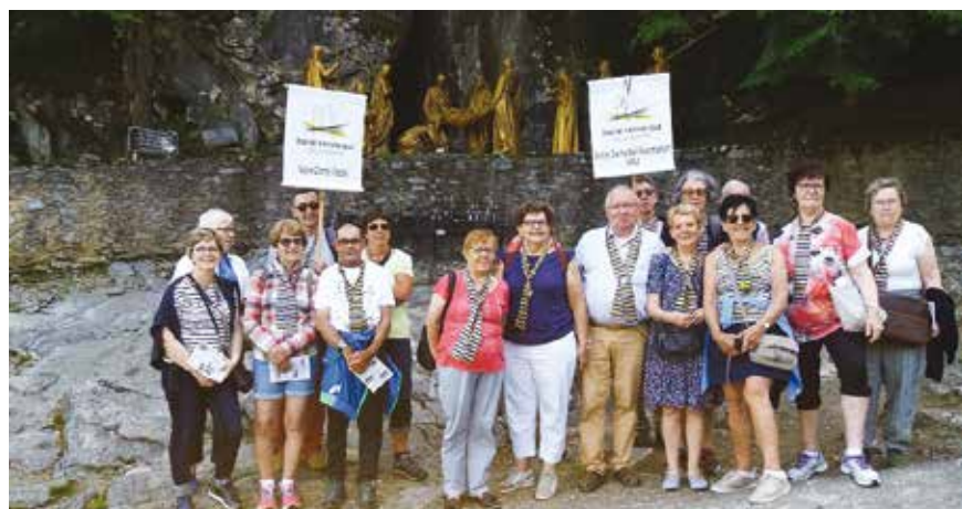
■ Le groupe de pèlerins de Haute-Somme réunie au pied du sanctuaire marial.