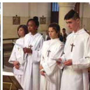
NESLES / P8 Profession de foi