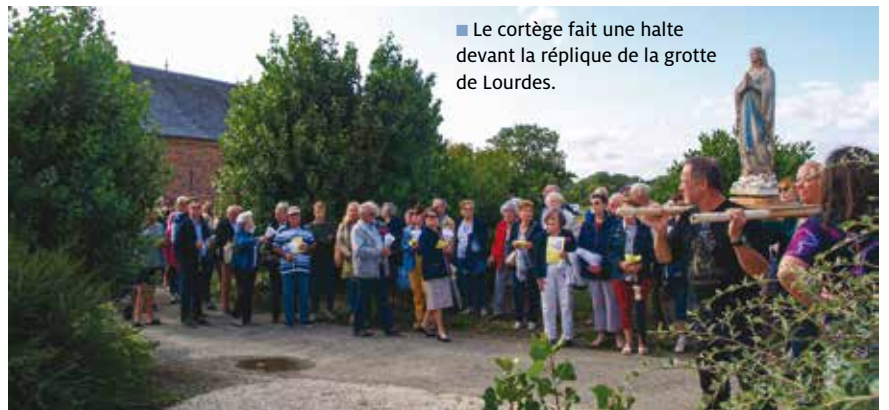
■ Le cortège fait une halte devant la réplique de la grotte de Lourdes.