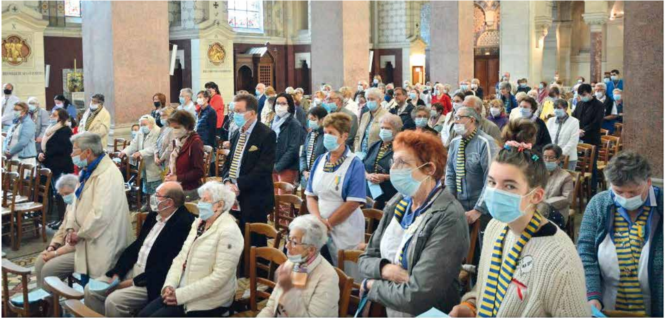
■ Les pèlerins à la basilique d'Albert.