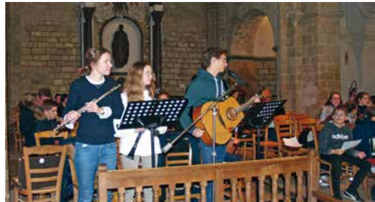
■ Les jeunes musiciens ont donné le ton à la cérémonie.

Ainsi, la soixantaine de fidèles clairsemés dans la nef a pu assister à une célébration malgré tout très chaleureuse, accompagnée avec beaucoup de ferveur par un groupe de jeunes musiciens des paroisses du secteur de Haute-Somme, qui ont également participé aux lectures et aux chants litur-