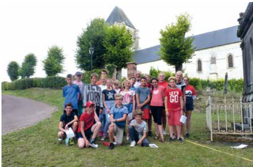
■ Camps MRJC à Chaussoy-Epagny.

Comme toujours, nous avons fait une découverte du territoire sous forme de jeux ou d'enquêtes. Cette activité est l'un des traits caractéristiques des camps du MRJC : nous intéresser à la vie des gens du territoire sur lequel nous sommes installés. Sur Chaussoy, nous avons pu aller à la découverte d'initiatives du territoire par petits groupes :