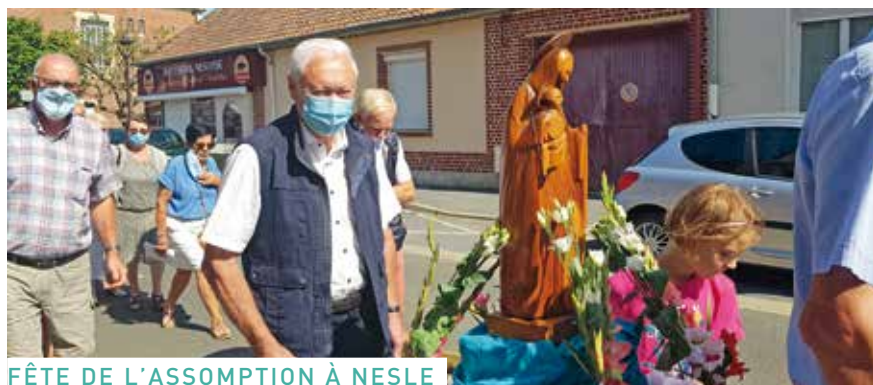
FÊTE DE L'ASSOMPTION À NESLE

La communauté paroissiale s'est retrouvée le jour du 15 août pour fêter sainte Marie. La messe a été très chantante: Magnificat! Puis l'assemblée a suivi la statue de la Vierge en procession en chantant l'Ave Maria et en priant le chapelet, de la collégiale à la chapelle du Bon-Secours. Le Je vous salue Marie et la prière de Notre-Dame de l'Assomption ont conclu cette belle cérémonie.