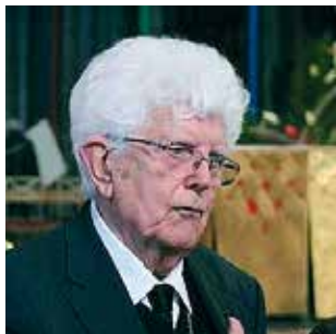
AMIENS / P4 Adieux à Monseigneur Noyer