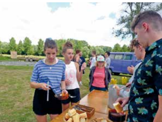
■ Camps MRJC à Authie.