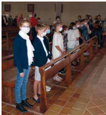
■ À l'église Saint-Martin d'Eppeville.