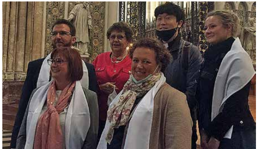
■ Les adultes de Ham qui ont reçu le sacrement de confirmation à Amiens.