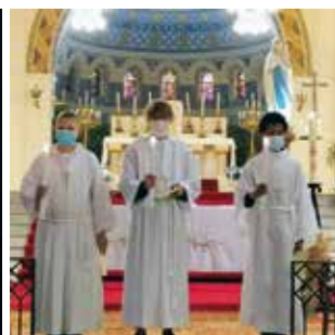
P8 Professions de foi à Nesle