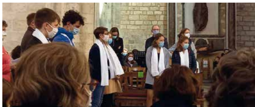
■ À l'abbatiale Notre-Dame de Ham.