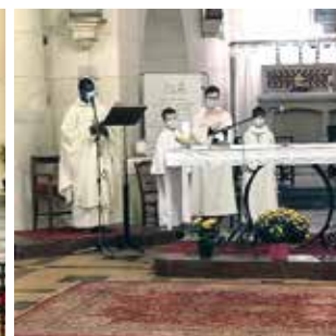
P10 Nous avons fêté «tous les saints»