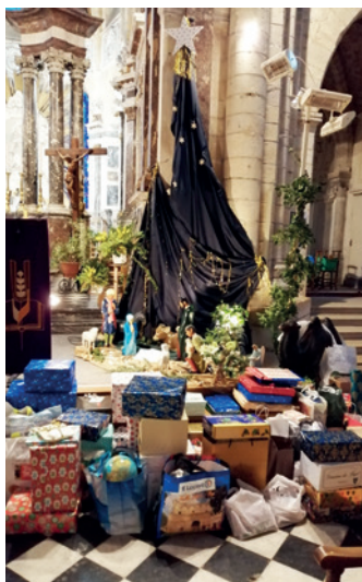
■ Les cadeaux déposés au pied de la crèche dans l'abbatiale de Ham.

– Marie Dominique Dossin au 03 22 87 95 50 – Thérèse Lemaire au 03 23 81 05 45