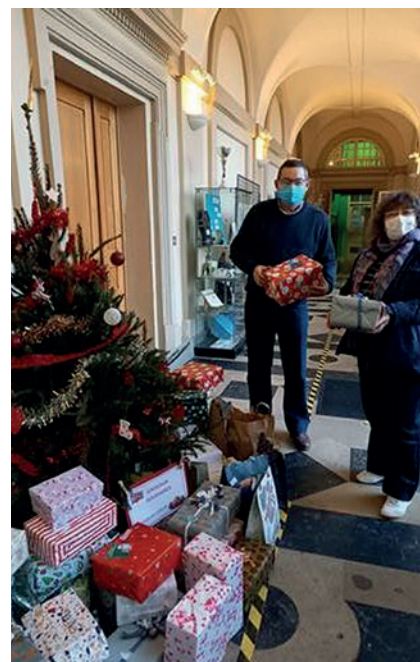
■ La remise des cadeaux aux Restos du cœur à Ham.