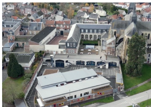
■ L'Institut Notre-Dame avec au premier plan le nouveau bâtiment de l'école maternelle inauguré en 2020.

Elle permet au jeune de développer toutes leurs capacités et de les aider à découvrir le sens de la vie, de les éduquer à la solidarité tout en étant artisan de paix et d'unité. Elle les encourage à donner le meilleur d'eux-mêmes tout en apprenant à vivre ensemble, à s'accepter différents et à se respecter. Elle accompagne également les élèves qui le désirent dans leur démarche per-