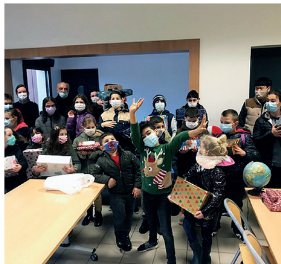
■ La remise des cadeaux aux enfants de la plaine Saint-Martin.