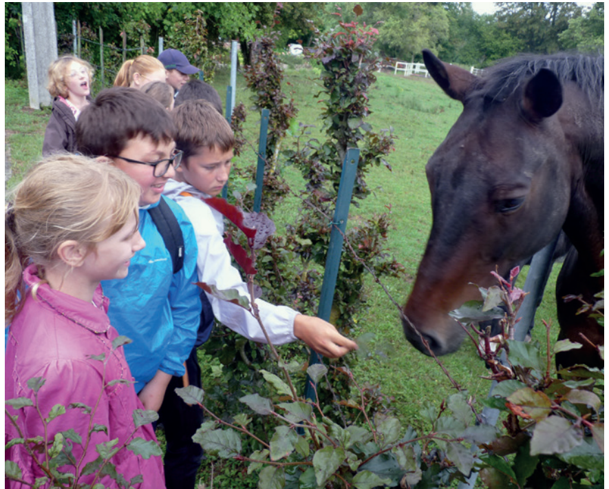
■ Souvenir de camps à Chaussoy.

Ce titre un peu provocateur, c'est l'état d'esprit du MRJC (Mouvement rural de jeunesse chrétienne) qui continue d'animer les équipes et de faire des projets... Pour les vacances de Pâques, les séjours courts prévus veulent rassembler de nombreux jeunes pour profiter du retour du printemps : la nature se réveille et les petits oiseaux chantent... En minicamps, les jeunes sont invités à s'éveiller, peut-être à se réveiller mais en tout cas à chanter autour du feu de camp.