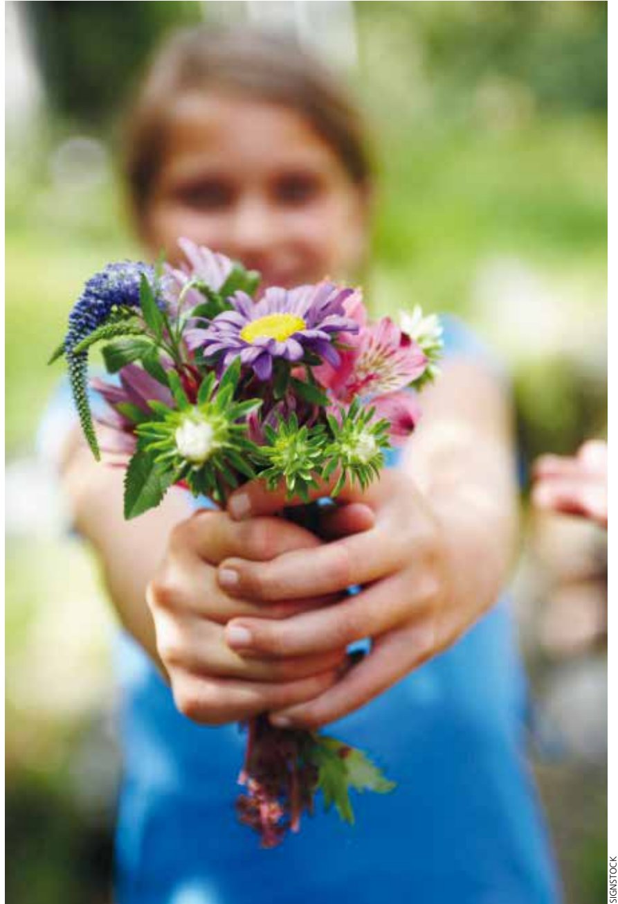
Offrir un bouquet de fleurs, quelle joie !

fleurs nous fait penser à la création. C'est comme à l'offertoire, quand j'apporte le pain et le vin.