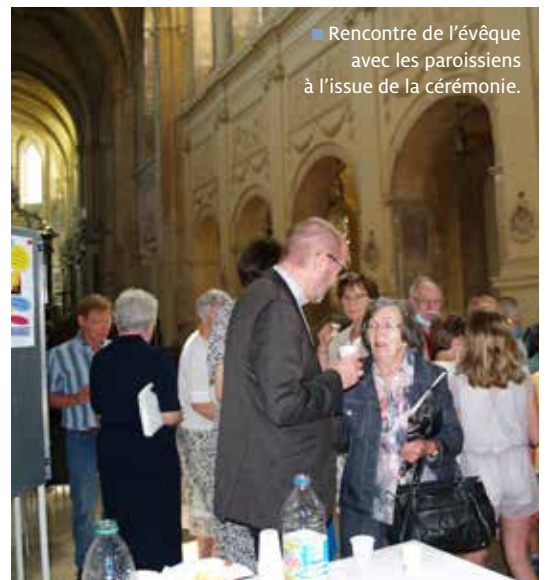
■ Rencontre de l'évêque avec les paroissiens à l'issue de la cérémonie.