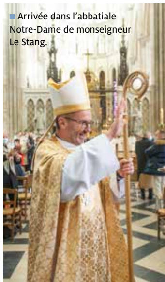
■ Arrivée dans l'abbatale Notre-Dame de monseigneur Le Stang.