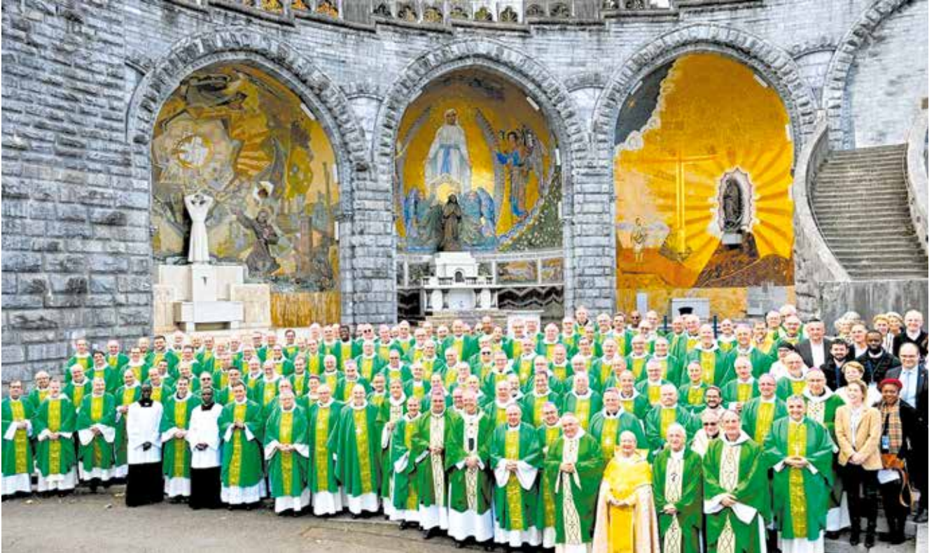
Un beau rassemblement des évêques de France dans la basilique souterraine.

Les évêques de France se sont réunis pour leur assemblée plénière d'automne du 3 au 8 novembre à Lourdes.