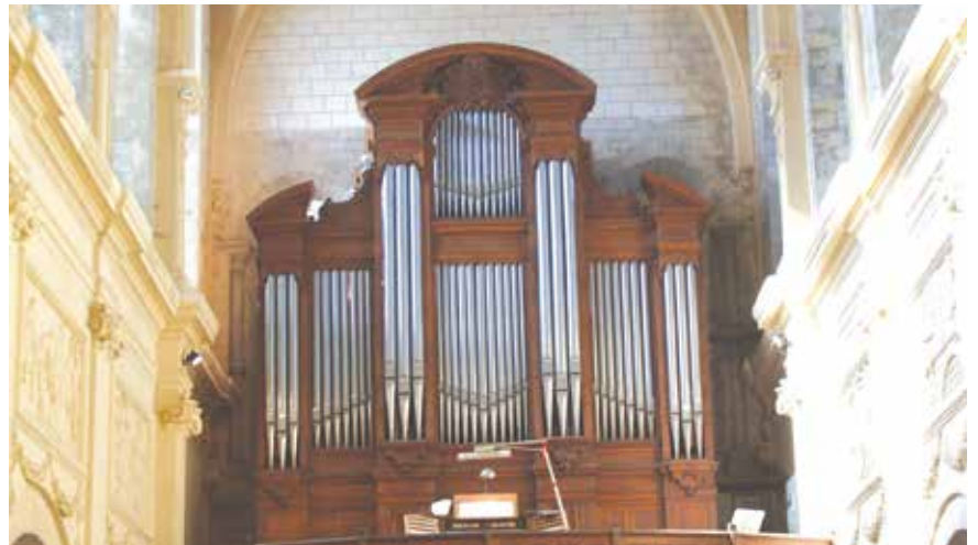
Le buffet de l'orgue vu de l'intérieur de la nef de l'abbatiale.

C'est avec joie que nous vous annonçons le lancement de la campagne participative pour la restauration de votre grand orgue de l'abbatiale, en partenariat avec la ville de Ham et la Fondation du Patrimoine.