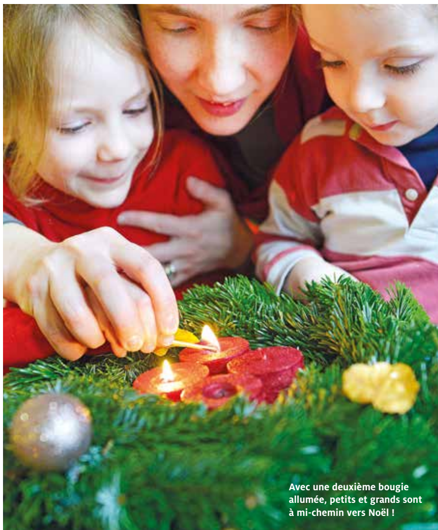
Avec une deuxième bougie allumée, petits et grands sont à mi-chemin vers Noël !