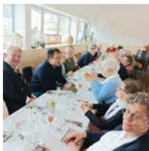
SAINTE-RADEGONDE / P10 Repas de chorale et fraternité