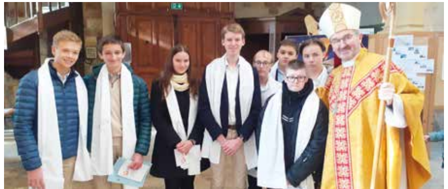
■ Monseigneur Le Stang entouré des jeunes confirmés.

Les jeunes de Ham ont reçu le Saint-Esprit en cette fête du Christ-Roi, le 26 novembre dernier.