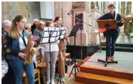
■ Les jeunes musiciens ont accompagné la célébration.

privilegiés pour accueillir et vivre les différentes étapes de préparation au sacrement du baptême d'enfants scolarisés ou de préparation au sacrement de l'eucharistie. Lors de la messe adaptée aux enfants du dimanche 11 février, l'assemblée paroissiale a eu la joie d'accueillir seize enfants de 4 à 12 ans qui souhaitent recevoir le baptême, et trente-quatre enfants qui se préparent à la première des communions. Quelle joie pour la communauté paroissiale d'accompagner tous ces jeunes et d'accueillir leurs parents ! Ils ont symboliquement frappé à la porte de l'église et l'abbé Léon est venu