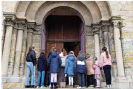
■ Les enfants attendent d'être accueillis devant le portail de l'abbatiale.

Ces célébrations sont également des temps