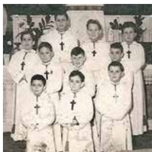
ESMERY-HALLON / P5 Le bon vieux temps de Pâques

PÂQUES « NÔTRE VIE NE S'ARRÊTE PAS À LA TOMBE »