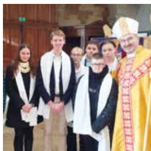
CONFIRMATION / P6 Huit jeunes ont reçu l'Esprit saint